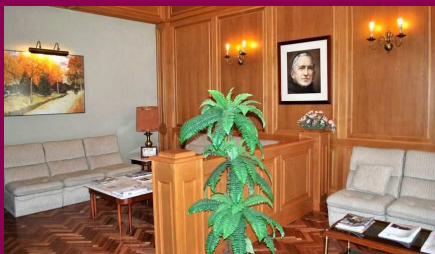
Sala de espera