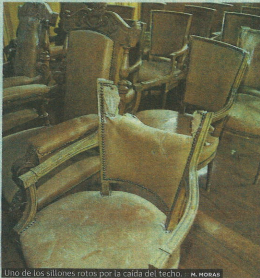
Uno de los sillones rotos por la caída del techo.