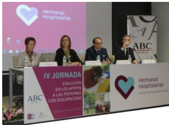
MESA INAUGURAL IV Jornada sobre Discapacidad 10-03-2017 "Evolución en los apoyos a las personas con discapacidad"